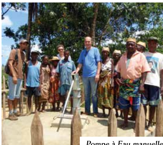
Pompe à Eau manuelle