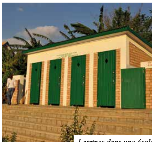
Latrines dans une école