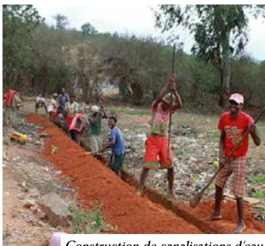
Construction de canalisations d'eau

En 10 ans, des millions d'euros ont ainsi été investis en aménagement mais aussi en formation auprès des maires, agents communaux ou gestionnaires de réseau.