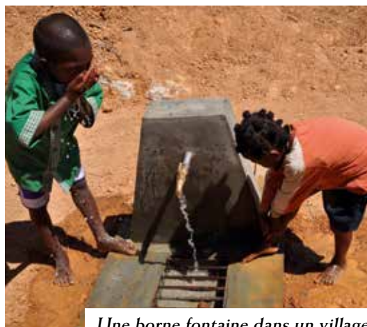
Une borne fontaine dans un village