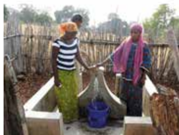
Guinée - Naddhal - SAGA

d'ONG et de structures porteuses de projets sérieux dans des pays du sud (ex : Guinée, Burkina Faso, Mali, Haïti, Cameroun Togo, Sénégal, Niger, Vietnam etc.). Depuis le démarrage, 231 projets ont été soutenus permettant l'accès à l'eau à plus de 1 862 700 personnes, dont 266 000 pour la seule année 2017.