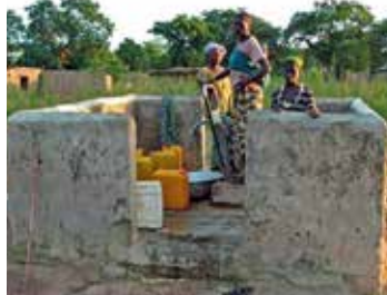
Boura - Burkina Faso - Comité de jumelage Limonest Boura