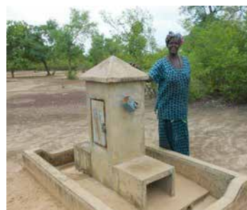
Mémissala - Mali - ARCADE